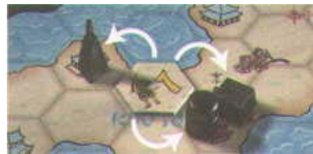
Una ficha con poder 1 influye en la captura de un Yelmo, un Buda y un arrozal.

Las influencias de una ficha sirven para capturar todas las figuras adyacentes del tipo indicado en la ficha: