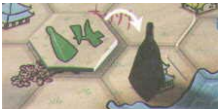
Una ficha con poder 4 influye en la captura del Yelmo.

Con una excepción (Cambio de Figuras, ver más abajo), todas las fichas tienen un número que representan su poder: