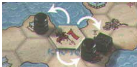
Las 3 figuras son afectadas por el Ronin.