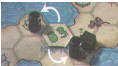
Ambos Budas son afectados, pero el campo de arroz no.

Las influencias de una ficha sirven para capturar todas las figuras adyacentes del tipo indicado en la ficha: