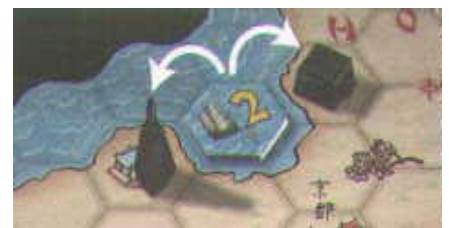
Las dos figuras son afectadas por el Barco.